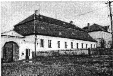
Fara v Babicích